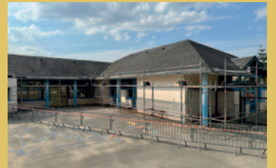
Le préau Dalo a été monté le 14 août 2023 en sortie maternelle.