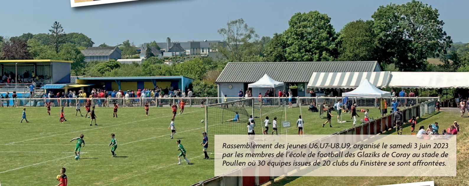
Rassemblement des jeunes U6.U7-U8.U9, organisé le samedi 3 juin 2023 par les membres de l'école de football des Glaziks de Coray au stade de Poullen où 30 équipes issues de 20 clubs du Finistère se sont affrontées.

L'Association des Parents d'Élèves de l'école de Leurgadoret a organisé le samedi 11 juin 2023 la fête de l'école qui débutait le matin par un spectacle des enfants. Ensuite une restauration était proposée. Et l'après midi : place aux jeux pour le bonheur de tous. Un marché de Noël le dimanche 10 décembre 2023 et un loto le 3 février 2024 à Trégourez sont les événements proposés par le nouveau bureau de l'APE.