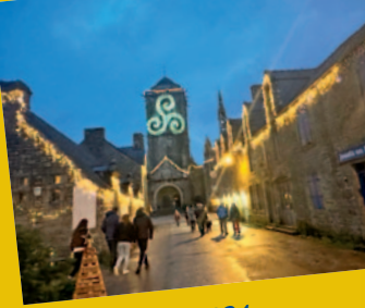
Départ pour admirer les illuminations de Noël à Locronan le 4 janvier 2024