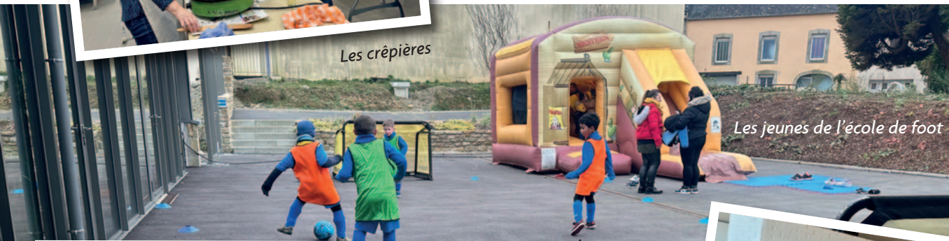
Les jeunes de l'école de foot