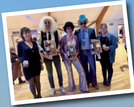
Les vainqueurs et le jury du bal masqué dans le cadre de Coray fête les gras le samedi 17 février 2024