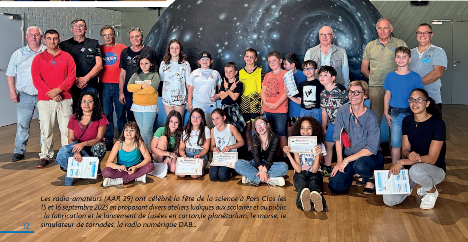
Les radio-amateurs (AAR 29) ont célébré la fête de la science à Pors Clos les 15 et 16 septembre 2023 en proposant divers ateliers ludiques aux scolaires et au public : la fabrication et le lancement de fusées en carton, le planétarium, le morse, le simulateur de tornades, la radio numérique DAB...