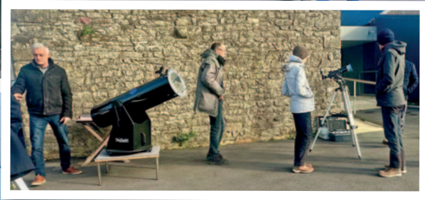
L'association Loar Gann