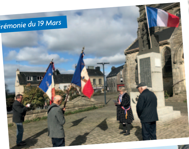
Cérémonie du 19 Mars