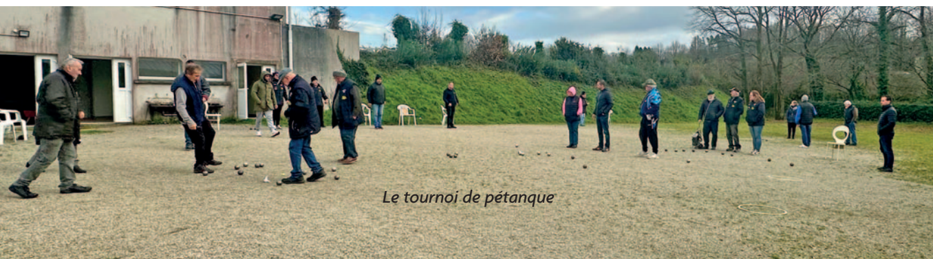
Le tournoi de pétanque