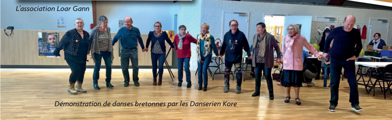
Démonstration de danses bretonnes par les Danserien Kore