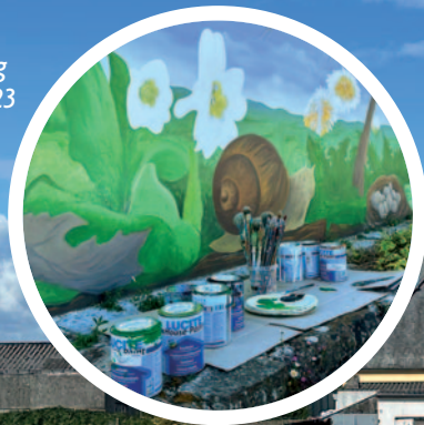
Réfection fresque du parking de la mairie durant l'été 2023 par Loriane LE GRAND.