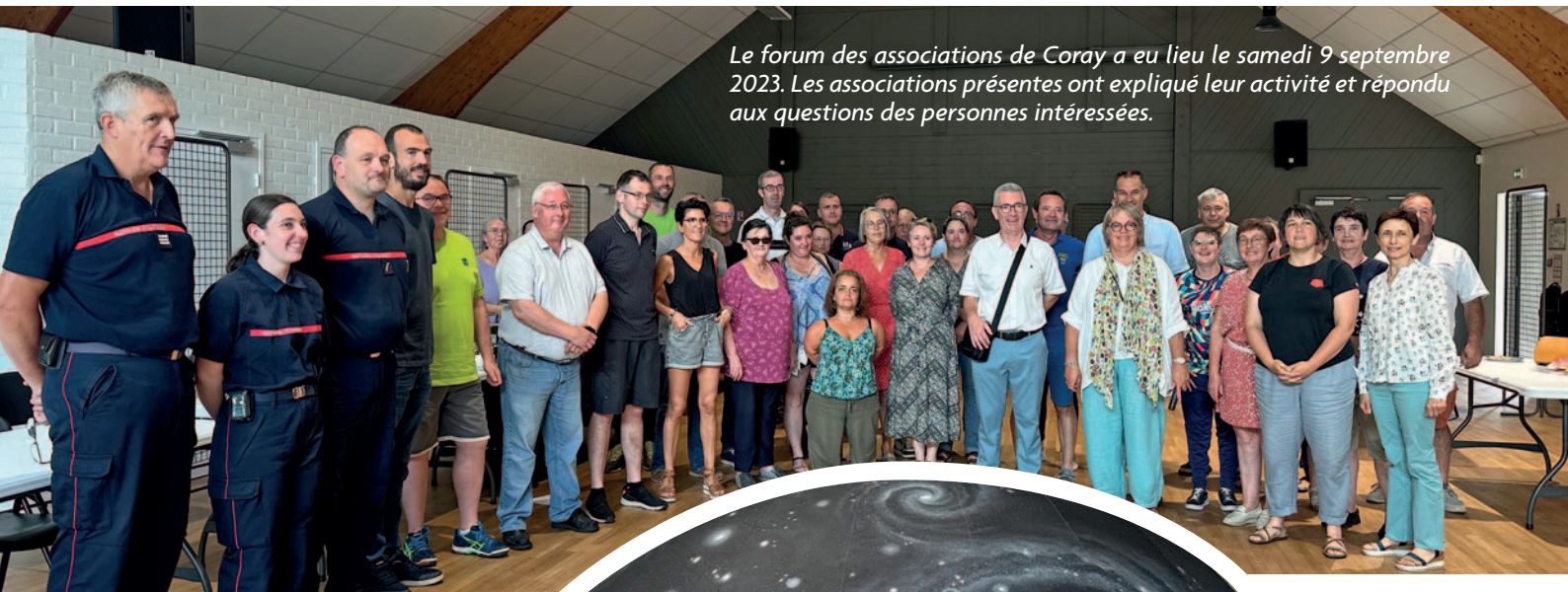
Le forum des associations de Coray a eu lieu le samedi 9 septembre 2023. Les associations présentes ont expliqué leur activité et répondu aux questions des personnes intéressées.