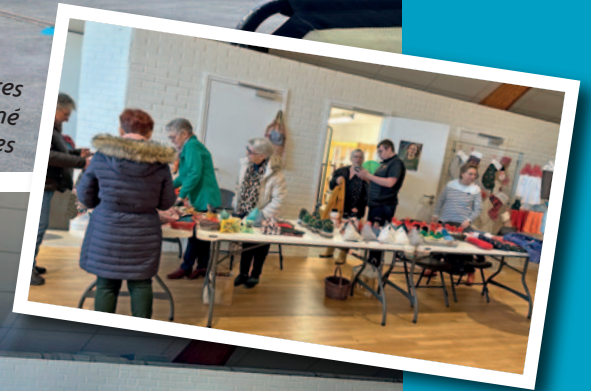
Les couturières avaient confectionné différents petits ouvrages