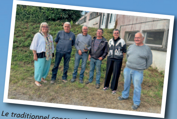
Le traditionnel concours de pétanque de la Saint-Pierre, en doublettes constituées, s'est déroulé le samedi 1 er juillet 2023 au boulodrome de Poullen.